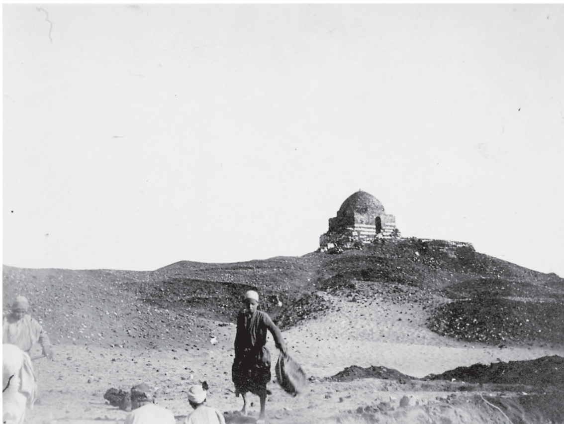
Ossirco. Il Kôm Abu Teir.