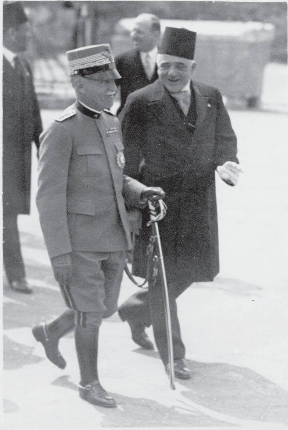
Vittorio Emanuele III ed Evaristo Breccia ad Alessandria nel marzo 1933.