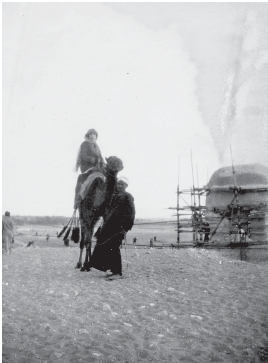
Medea Norsa presso la sfinge in restauro - Giza (1926).