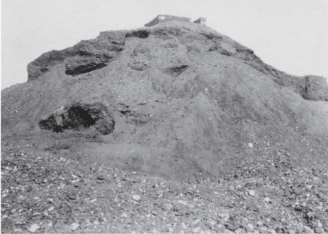
Ossirinco. Il kôm Ali Gamman prima dello scavo.