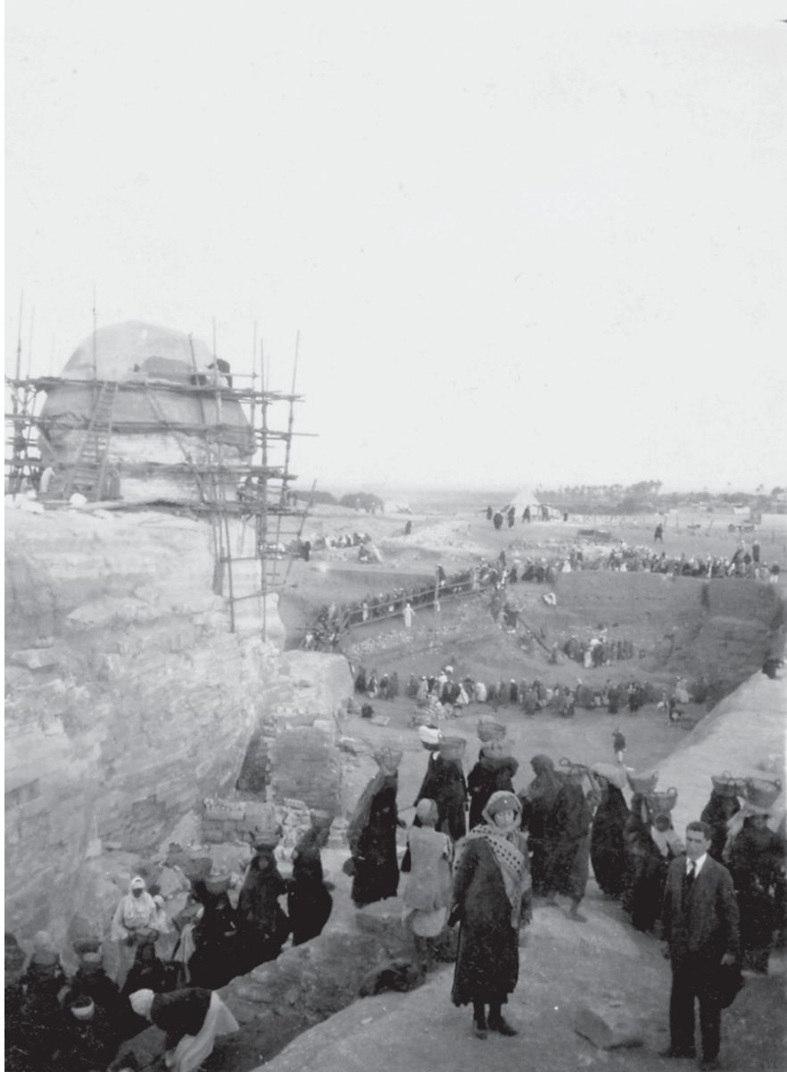
Medea Norsa ed Angelo Segré presso la sfinge in restauro - Giza (1926).