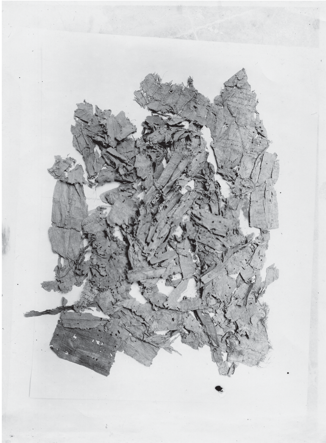
Frammenti di papiro recuperati dallo scavo.